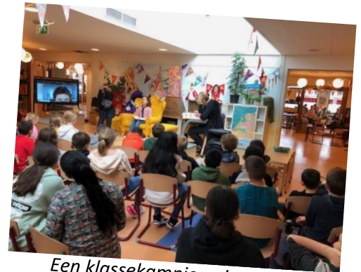
Een klassekampioen in actie

Op 24 en 25 november en 1 december zijn weer de Voorleeswedstrijden gehouden voor de groepen 5 tot en met 8 op beide locaties. Iedere groep had al eerder tijdens voorrondes in de eigen groep gekozen welke twee kandidaten mochten voorlezen in deze Voorleeswedstrijd. De jury had het niet makkelijk: alle kandidaten hebben het heel goed gedaan en kregen een groot applaus van het luisterend publiek. Uiteindelijk zijn de winnaars geworden: