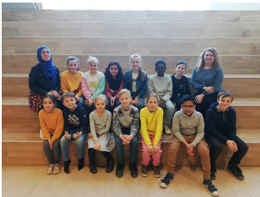
De leden van de leerlingenraad