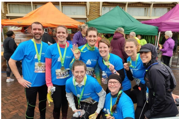
De teamleden die mee hebben gedaan met de LansingerlandRun

Wij zijn super trots op alle kanjers die mee hebben gedaan en hopen volgend jaar op nog meer sportievelingen!